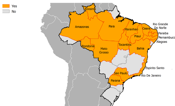
Fig. 2 - Etats du Brésil rapportant des cas confirmés de Zika, 22 décembre 2015